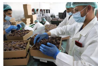
L'atelier en septembre 2020

Le financement du projet dans ses phases successives, soit environ 670 k€ sur la période, a été assuré par