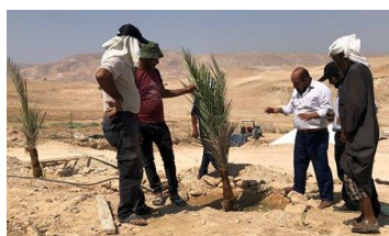
Les dernières plantations en septembre 2020

Une chambre froide d'une capacité de 60 tonnes a été installée à Jiftlik avec des panneaux solaires.